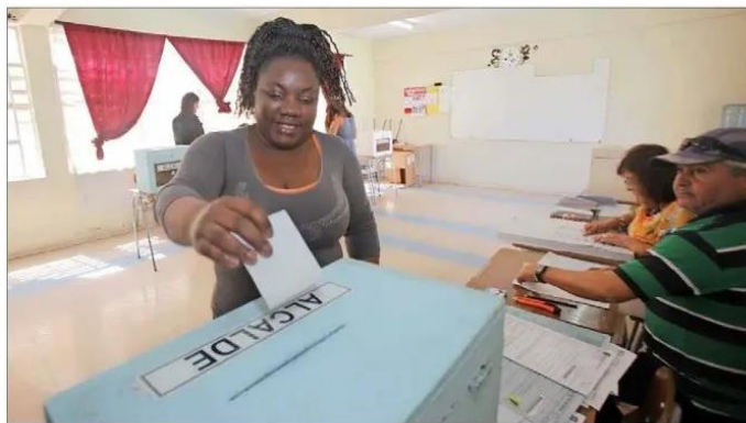
PARTICIPACIÓN. — Los inmigrantes con residencia definitiva también han generado un aumento en el padrón electoral. En la foto, una extranjera vota en Antofagasta para el plebiscito de octubre pasado.

Desde 2000, en Chile se ha otorgado este beneficio a 708.876