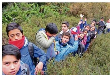
EL CIENTÍFICO RECALCA QUE SE DEBE MANTENER EL VÍNCULO ENTRE SENDA DARWIN Y LA COMUNIDAD.

“Este período ha sido difícil por la imposibilidad de mucha gente de llegar a la estación, por el problema sa-