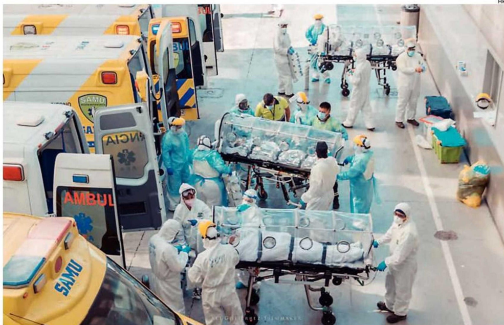
FUERON TRASLADADOS 5 PACIENTES DEL HOSPITAL REGIONAL HASTA LA REGIÓN METROPOLITANA.