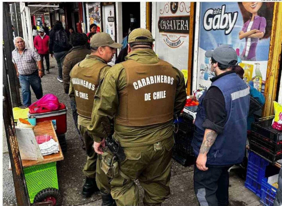
LOS DESPLIEGUES DE CARABINEROS POR EL SECTOR CÉNTRICO SE HAN INTENSIFICADO DESDE EL AÑO PASADO EN LA CIUDAD DEL PUDETO.

Dentro de los últimos operativos, comandados por equipos de la Sección de Investigación Policial (SIP) de la unidad base, dos ambulantes de 30 y 41 años fueron detenidos al hallarse en su poder especies piratas que comercializaban en la misma Plaza de Armas de