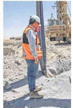
LA APUERTA DE CHUQUICAMATA PA

cer extensivo, es llamar al autocuidado a la comunidad, que retome el autocuidado que en algún momento tuvimos en pandemia, de hecho, ya es obligatorio que en Urgencia se use la mascarilla, nosotros además recomendamos su uso en otras áreas del hospital, como es el caso de quienes visiten a personas hospitalizadas. Llamamos a los grupos de riesgo a usar mascarilla también, sobre todo cuando vean que hay alta aglomeración de personas en sitios muy cerrados”, realzó Bahamondes. 🙏