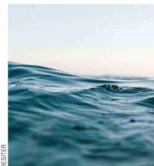
La tecnología permite obtener recursos libres de contaminantes, como agua limpia, arena tratada y residuos de hidrocarburos recuperados.

• Recuperación de suelos: La arena tratada es almacenada en estanques y se transporta para su uso en la rehabilitación de áreas