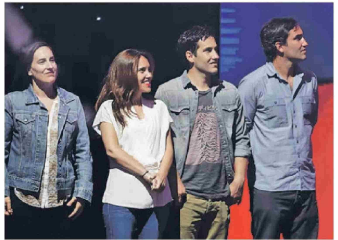
Los herederos del expresidente Sebastián Piñera.