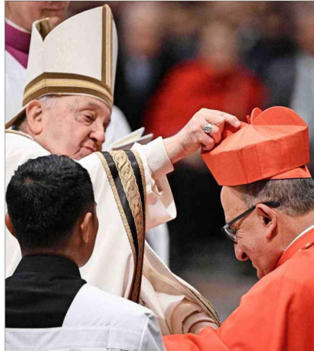
SÍMBOLOS. — De manos del Papa, el arzobispo de Santiago recibió la birreta roja, que simboliza la disposición a defender la fe, y el anillo cardenalicio.

Sobre las responsabilidades que conlleva ser nombrado como cardenal, el historiador Cris-