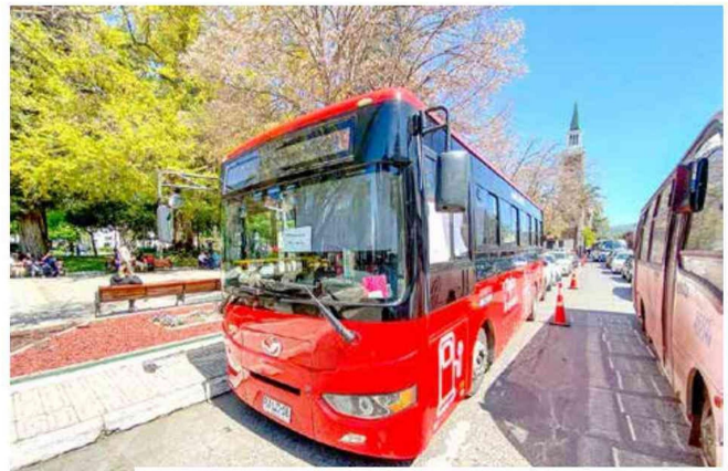
El servicio de buses eléctricos de Talca se ha convertido en un referente a nivel nacional.

la ciudad. Con un tiempo de carga por bus de solo 45 minutos, puede operar de manera eficiente durante todo el día sin necesidad de una nueva carga, puesto tiene una autonomía por carga de 120 kilómetros y la ruta de cada bus, es de aproximadamente 100. De esta forma, la flota compuesta por ocho buses, recorre 16 mil kilómetros al mes sin emitir un solo gramo de CO2. Este servicio, que se mantiene operativo gracias a la dedicación de los nueve choferes y asistentes que conforman el equipo, ha logrado alcanzar un promedio mensual cercano a los 16 mil usuarios, proyectando