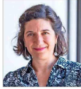
Aisén Etcheverry Ministra de Ciencia, Tecnología, Conocimiento e Innovación