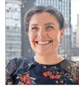
Gabriela Elgueta Subsecretaria de Vivienda y Urbanismo

Ingeniera en Construcción y militante de Renovación Nacional. Es la mujer más joven en ser designada senadora, cargo que defendió por la Región de Los Ríos, antes de gobernar de Valdivia entre 2018 y 2019. Este 2024 asumió como presidenta de la comisión de Vivienda y Urbanismo del Senado. Desde ahí, ha sido clave en los esfuerzos por enfrentar el déficit habitacional, además de acelerar los permisos de construcción. Uno de sus principales logros fue la aprobación del proyecto de ley que simplifica los trámites administrativos desde el inicio de los proyectos hasta la entrega de las viviendas.