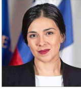
Karol Cariola Presidenta de la Cámara de Diputadas y Diputados

Matrona, lleva 10 años como diputada. Actualmente preside la Cámara de Diputadas y Diputados. Cariola es la quinta mujer en ocupar el cargo, además de ser la más joven en esa posición, demostrando que vivir un embarazo "no nos imposibilita" para continuar nuestras labores, dice. Desde la legislación, ha tenido un rol activo en la rebaja laboral a 40 horas, la tarifa de invierno, Ley Gabriela, la rebaja a la tarifa del pasaje al adulto mayor, entre otras, todas normativas ya aprobadas y/o en vigencia. Otros proyectos de su autoría en tramitación son el de equidad salarial y el que elimina las preexistencias.