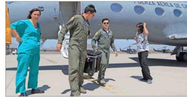
En Chile, todos los mayores de 18 años son donantes, salvo que la persona exprese su deseo de no serlo con una declaración jurada ante notario. Pero, al final, la opinión de la familia es decisiva.

Mejorar la comunicación e información es clave, además, para revertir porcentajes preocupantes, según Buckel, como que casi un tercio (29%) dice que no donaría por desconfianza hacia el sistema de listas de espera y el 19% por temor a que lo dejen morir para usar sus órganos. “Todos los profesionales que participamos del proceso damos fe de que las listas de espera son transparentes y que se manejan según criterios internacionalmente aceptados”.