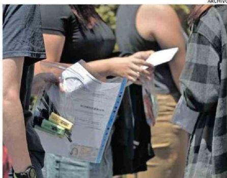
MILES DE ESTUDIANTES RENDIRÁN EL EXAMEN.