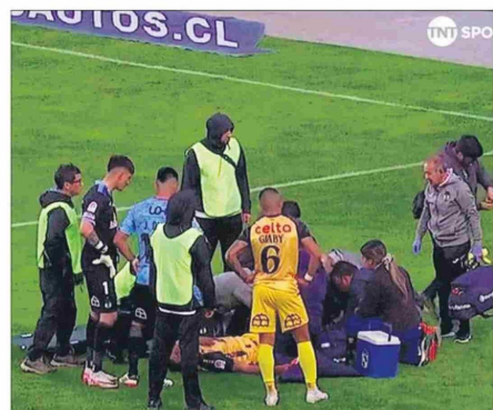
Momentos de alta tensión se vivieron en el estadio El Teniente y Mettifogo fue retirado en ambulancia.

hombre, pero es calladito, de bajo perfil".