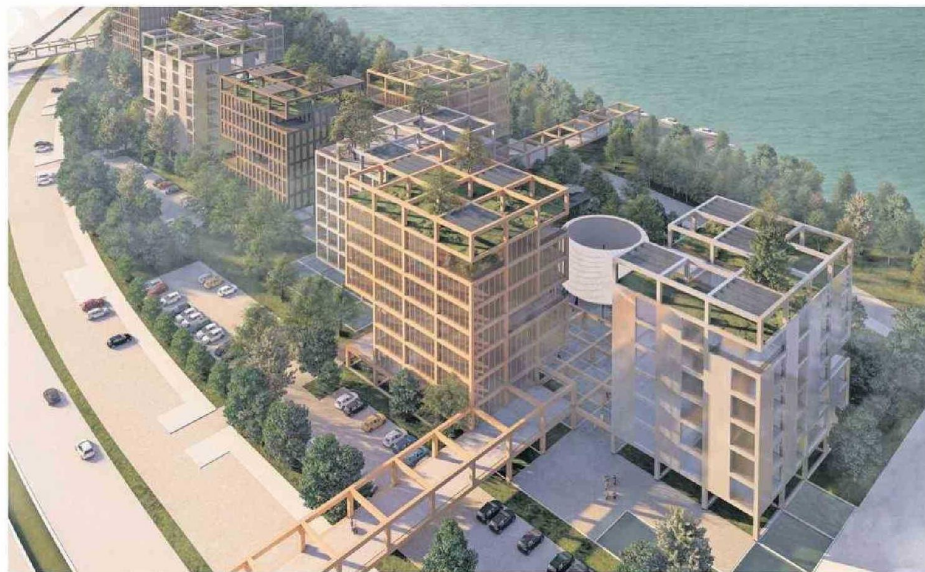
En total, el proyecto abarca tres fases de construcción que se materializarán en un lapso de 16 años.

Bajo una estrecha colaboración del Enterprise Innovation Institute de Georgia Tech, la iniciativa pretende formar y retener capital humano en la Región, así como atraer capacidades, con una propuesta que apunta a concentrarse en conectividad avanzada, consumo sostenible e inteligencia artificial. Para llevar a cabo el proceso se estudiaron más de 100 distritos de innovación en el mundo, tarea en la que se comprobó que distritos de este tipo requieren más de un financista.