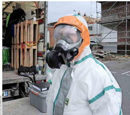
La remoción de asbesto se debe realizar de manera muy cuidadosa por las enfermedades respiratorias que se pueden generar al inhalar el material.

Considerando que el asbesto es un material que está presente en el hogar, es necesario tomar ciertas precauciones: "Por ejemplo, si tiene una muralla de cemento asbesto, uno clava un