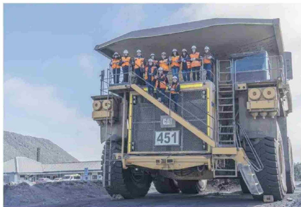
El 98% de los trabajadores viven cerca de las faenas, favoreciendo la calidad de vida de las personas.

Un ejemplo de ello es la Planta de Pellets, ubicada en la comuna de Huasco, que ha llevado a cabo dos importantes iniciativas en los últimos cuatro años, como la implementación de dos precipitadores electrostáticos para reducir emisiones de CO2 y, por otra, un proyecto pionero de relaves filtrados con restauración ecológica que, a través de la fitorrestauración, gestiona de forma óptima la reubicación de desechos no tóxicos.