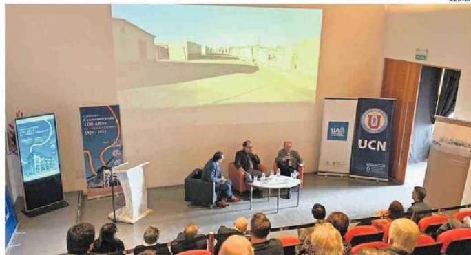
POR LA IMPORTANCIA QUE TIENE PARA LA REGIÓN Y EL PAÍS MANTENER EL LEGADO DE CHACABUCO.

En conversatorio organizado por la Corporación Museo del Salitre Chacabuco, la UCN y la UA, especialistas abordaron estado actual y proyección del monumento nacional.