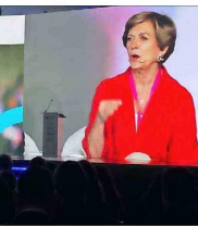
Evelyn Matthei en el panel por el crecimiento, donde destacó el caso argentino como un modelo imitable. “El gasto fiscal hay que reducirlo, como lo está haciendo en este momento Argentina, que por primera vez ha tenido un superávit fiscal”.