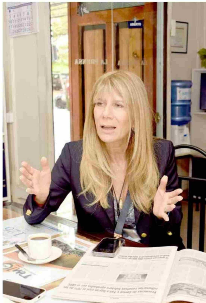
La senadora por la Región del Maule, Ximena Rincón, dijo que "nuestra agricultura necesita de autoridades de Gobierno preocupadas por lo que pasa en nuestro campo".

constitucional que el 63% del país le dijo que no. Y tras ello curiosamente el partido al que ella misma había renunciado anunció públicamente su expulsión.