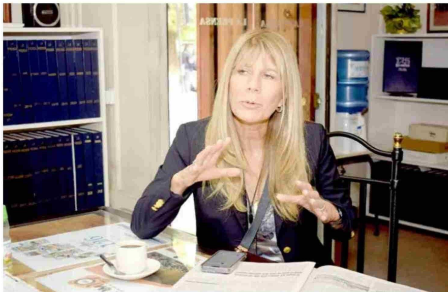
"El Maule Sur es una zona que tiene potencialidad, pero que ha faltado miradas estratégicas de desarrollo", dijo la senadora Ximena Rincón.