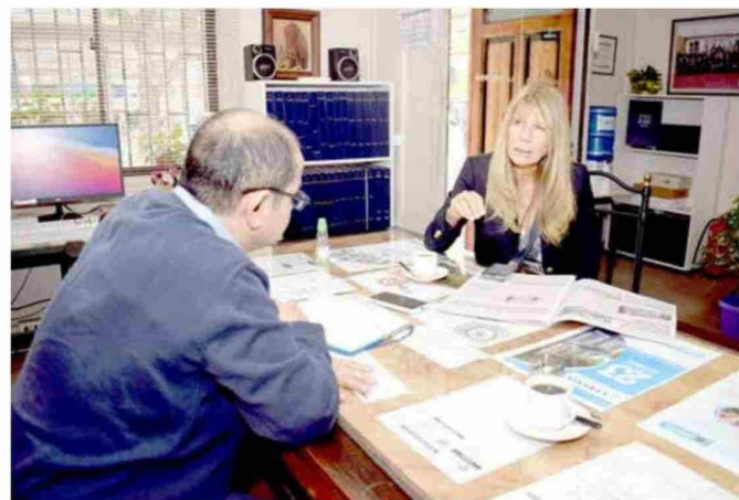
En las dependencias de diario La Prensa, en Talca, la senadora Ximena Rincón expuso las mayores problemáticas de la región.

General de la Presidencia en el segundo mandato de Michelle Bachelet. Pero en 2018 volvió a postularse por el Maule. En ambas ocasiones postulándose por la Democracia Cristiana resultó electa con una alta cantidad de votos. Hoy el escenario es distinto. Ya no es parte de la DC. Renunció al partido para apoyar la opción Rechazo a una propuesta