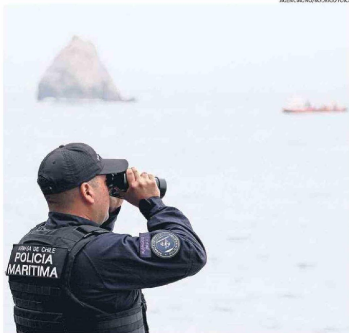
LA ARMADA SE ENCUENTRA DESPLEGADA JUNTO A OTRAS INSTITUCIONES BUSCANDO AL JOVEN.