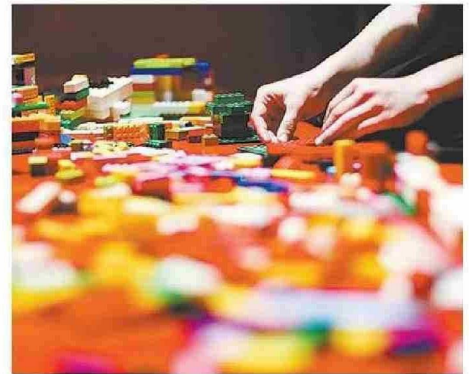
DOCUMENTO COMPLETO ESTÁ EN EL SITIO WEB DE LA DEFENSORÍA.

Informe publicado por la Defensoría de la Niñez revela que el 70% de las jóvenes ha recibido contactos de tipo sexual a través de redes sociales o plataformas digitales. Experta Upla analizó esta cifra y entregó recomendaciones.