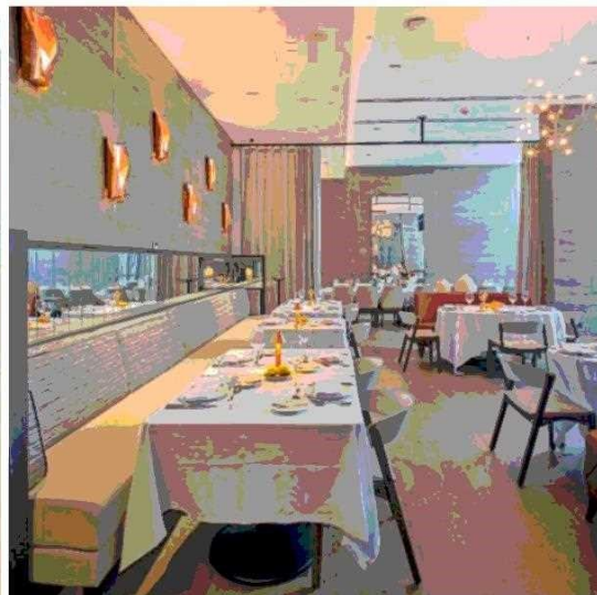
Madera, lino y detalles en cobre ambientan el restorán.