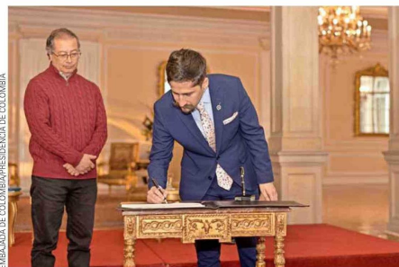
El embajador Guanumen asume su cargo ante el Presidente Gustavo Petro.

“Impulsaremos y daremos seguimiento a los temas acordados en la Visita de Estado que realizó el Presidente Gustavo Petro a Chile en 2023. Buscaremos generar encuentros del más alto nivel entre nuestras autoridades, dentro de ellos el mecanismo bilateral denominado Consejo de Asociación Estratégica (CAE). Trabajaremos por consolidar acuerdos que respondan a los diversos desafíos de la agenda internacional, como el cambio climático, la construcción de la paz y las desigualdades existentes en el sur global. Todas estas acciones e