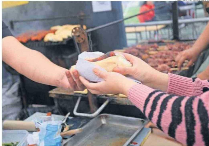
MINSAL CURSÓ MÁS DE 150 SUMARIOS SANITARIOS Y ESPERA REALIZAR 1200 FISCALIZACIONES EN FIESTAS PATRIAS.

Sobre la inclusión de estas advertencias en publicidad y medios digitales, la subsecretaria señaló que se han fiscalizado 1.900 piezas publicitarias: “En su implementación hay un cumplimiento de un 75% en todas las piezas audiovisuales que hemos