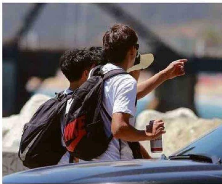
LA AVENIDA PERÚ ES SINDICADA COMO ÁREA DE PREOCUPACIÓN.

Guillermo Ávila Nieves La Estrella de Valparaíso