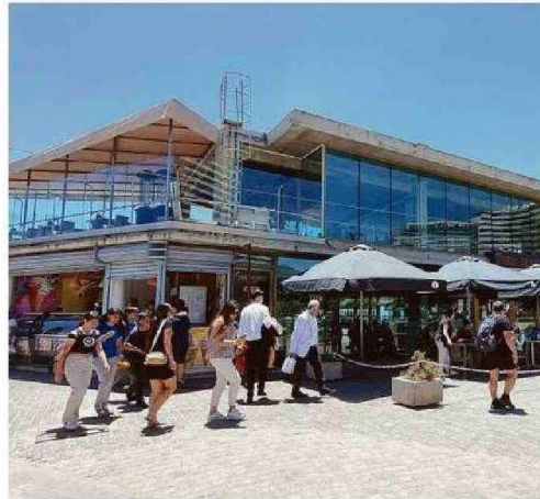
EN LAS TERRAZAS DE TIERRA DEL FUEGO SUFREN CON ASALTOS.