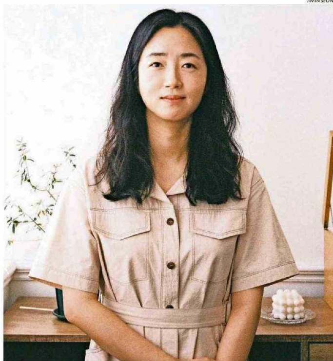
HWANG BO-REUM ES OTRA MUESTRA DE LA POPULARIDAD DE LOS AUTORES COREANOS EN EL PAÍS.

Hwang Bo-Reum Planeta 318 páginas $19 mil