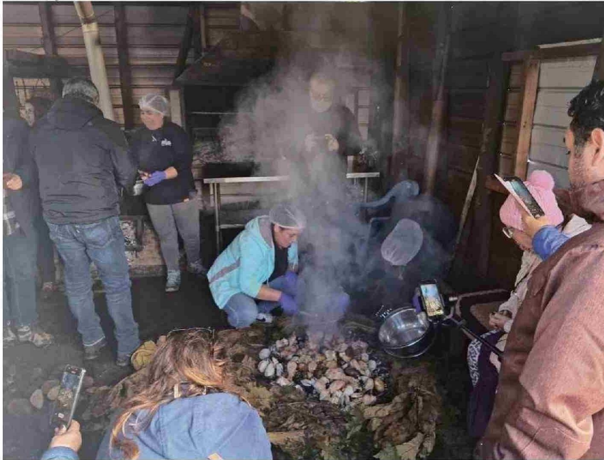
UNA DE LAS OPCIONES QUE OFRECE EL TURISMO RURAL ES DISFRUTAR DE COMIDAS TÍPICAS, COMO EL CURANTO AL HOYO.