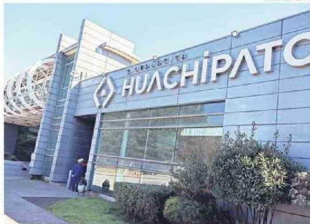
INDICARON QUE FUE UN FINAL DIGNO Y EMBLEMÁTICO.

"Incluso en este proceso doloroso de suspensión fueron ejemplo de resiliencia, operando de manera impecable hasta fabricar la última tonelada de acero planificada", agregó.