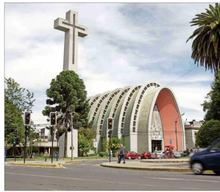
Once regiones anotaron retrocesos en su tasa promedio anual de desempleo respecto de 2023. En Nuble (cuya capital es Chillán, en la imagen) y La Araucanía promedió 10% en 2024.

2 Si bien el empleo formal lidera en la creación de puestos de trabajo, el dinamismo de este tipo de empleos sigue bajo y es por ello que la tasa de desempleo sigue muy alta en términos históricos. "Es preocupante la desaceleración del crecimiento en la ocupación en