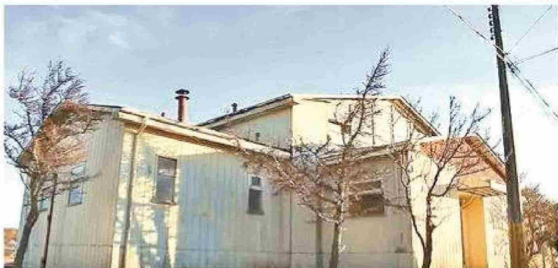
Las instalaciones que sirvieron de colegio.

En la década de los 60 el pueblo de Cullen, contaba con