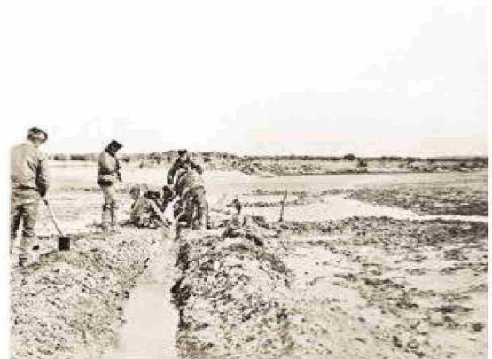
Expedición de Popper en río Cullen, Tierra del Fuego, en 1887.

más de mil personas. Durante el año 1960 se finalizó el diseño del pueblo o campamento de Cullen junto a la planta de tratamiento de gasolina. En 1961 funciona la Escuela Mixta donde se enseñará a los niños y niñas fueguinos. Esta escuela pública que albergaba unos 40 alumnos en 1962 y 2 profesores; se le suma la inauguración de canchas de juegos infantiles. La Escuela tiene un kindergarten hasta 6° grado de enseñanza básica. Con la industria de energía empieza a prosperar y hermosear la localidad de Cullen que es ornamentada y se foresta con más de mil quinientos árboles, más de una variedad de arbustos, plantas menores y flores. En los sectores cívico y comercial se instalaban cercados y la localidad queda urbanizada. En este pueblo fueguino había 90 familias radicadas. El radio urbano tenía capilla, casino, posta médica, bomberos, gimnasio, cine y por supuesto su Escuela. Para fortalecer la educación