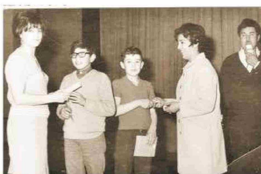
Alumnos de la Escuela G-42 de Cullen.