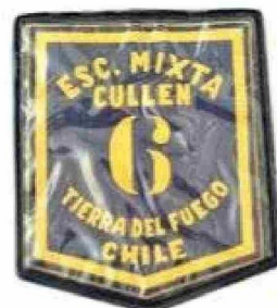
Insignia de la Escuela Mixta de Cullen.