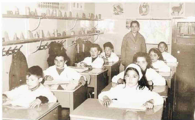
Sala de clases de la Escuela Mixta G-42 de Cullen, en 1966.