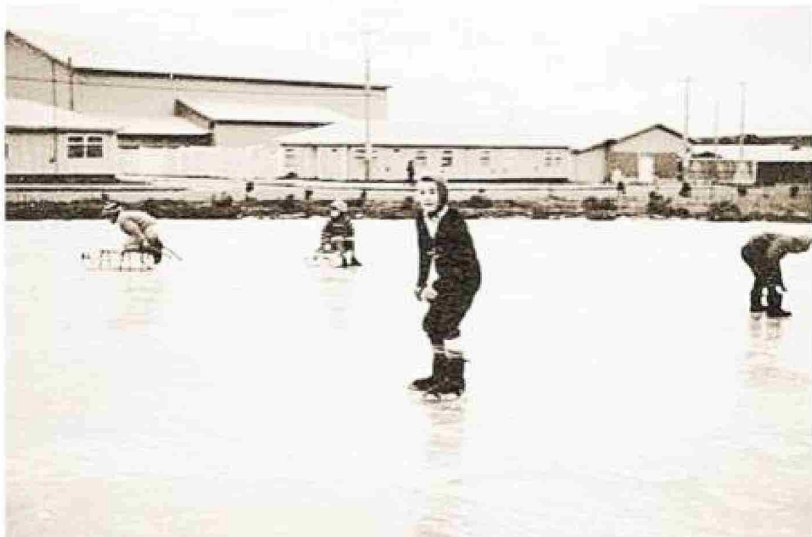
Pista de patinaje natural de hielo para disfrute de niños, jóvenes y habitantes de Cullen.

ma Segunda Región de Magallanes y de la Antártica Chilena queda como nueva denominación del establecimiento educacional Escuela G N°42 en el pueblo de Cullen. En los ochenta comienza la municipalización de la educación. Por su parte, en 1981 Enap se organiza como un holding de empresas. En 1984 se firma un contrato de compraventa de gas natural entre Enap y Signal Methanol y en 1988 se encuentran en producción treinta y seis pozos en nueve yacimientos costafuera que opera la empresa estatal. En 1990 se crea Sipetrol, Sociedad Internacional Petrolera S.A., filial de Enap, con el propósito de abordar las actividades de exploración y producción de petróleo y gas en el extranjero. Al correr el año 1992 se efectúa la obra pública de un poliducto Bandurria-Cullen para adquirir gas licuado de la República Argentina en el sector de la isla de Tierra del Fuego. Ya con la data de 1995 se cumple el cincuentenario de la comunidad petrolera magallánica chilena. Al finalizar el siglo veinte, en el 2000, se produce el aniversario de cincuenta años o medio siglo de la existencia de la Empresa Nacional del Petróleo, revalidando su gran labor económica, cultural y educativa en la Región de Magallanes.