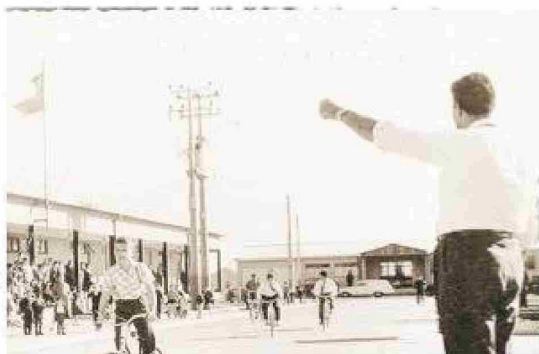
Competencia escolar en el poblado de Cullen.