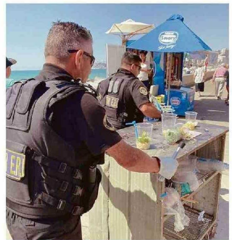
RETIRO DE CARROS Y COMERCIO AMBULANTE ILEGALES EN AV. PERÚ

Sin embargo, los vecinos consideran que estas medidas son insuficientes. “Si los operativos fueran diarios, los vendedores ilegales se aburrirían y no