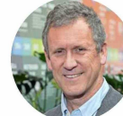
Juan Carlos Muñoz, ministro de Transportes y Telecomunicaciones.

para garantizar una movilización eficiente. Esta obra incluye la construcción de una doble vía de aproximadamente 100 kilómetros, además de mejoras en otros tramos críticos. Por otro lado, añade, se están desarrollando obras viales en Tierra del Fuego, como la pavimentación entre Manantiales y Porvenir, lo que fortalecerá la conectividad con los futuros puertos.