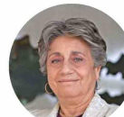
Jessica López, ministra de Obras Públicas.

El ministro Juan Carlos Muñoz destaca uno de los proyectos de ese paquete: la ampliación de la Ruta 9, que conecta Punta Arenas con la Ruta 255-CH. Explica que se trata de un proyecto prioritario