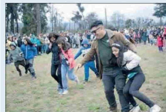
El evento ofrecerá una amplia variedad de actividades típicas, como juegos criollos, un patio de comida, viñas y cervecerías locales.

Al cierre de esta nota, el Centro de Alumnos de la Escuela de Medicina de la Universidad de Valparaíso nos hizo llegar una carta en la que hacen una relación de este y otros casos similares ocurridos en la universidad y en el país, y plantean que "existen muchos antecedentes de abusos en los internados, intentos de suicidios o suicidios, frente a los cuales la universidad debiese actuar como un factor protector frente a esto, pero está siendo el mayor estresor para propiciar estos hechos. Es así como se reitera la necesidad de una ley que nos proteja en los campos clínicos y una ley de salud mental en educación superior".