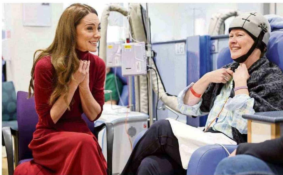
LA PRINCESA COMPARTIÓ CON LOS PACIENTES DEL HOSPITAL ROYAL MARDSEN.

REALIZA. Ayer visitó públicamente por primera vez el hospital en el que hizo su quimioterapia y compartió con pacientes y personal del recinto del que es patrona.