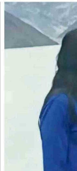
DUA LIPA Y SU VISITA DEL DOMINGO AL

Tras anunciar en septiembre que había completado su tratamiento de quimioterapia, comenzó un retorno "gradual" a la vida pública, con apariciones puntuales en compromisos oficiales como la ceremonia del Domingo del Recuerdo, en noviembre, o más recientemente con la celebración de su concierto anual de villancicos en la Abadía de Westminster.