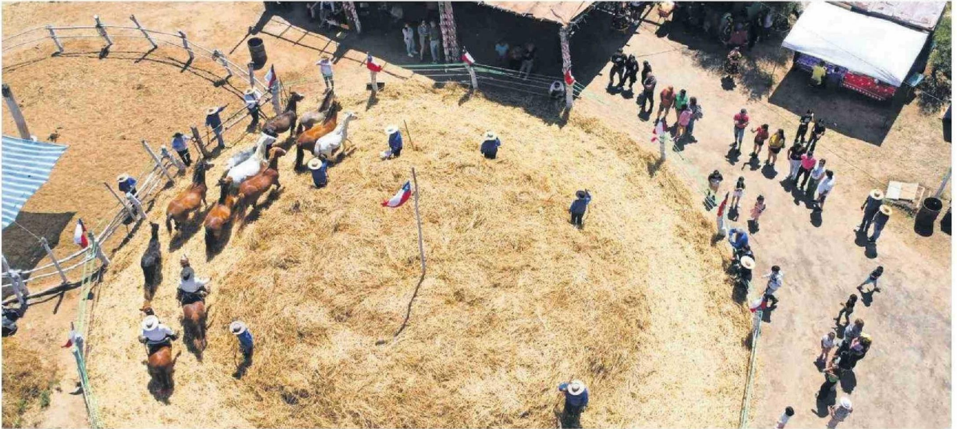
LA VISTA PANORÁMICA DE UNA ACTIVIDAD TÍPICA DEL MUNDO RURAL. EL FUNDO SAN RAMÓN ALBERGÓ LA UNDÉCIMA EDICIÓN DE LA TRILLA A YEGUA SUELTA, QUE REUNIÓ A TODO LA COMUNIDAD EN BASE A LAS TRADICIONES CHILENAS.