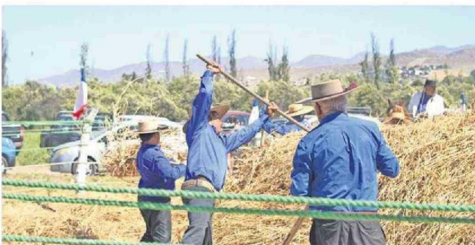
EL OBJETIVO DE LA ACTIVIDAD ERA FORTALECER LAS RAÍCES CULTURALES Y LOS LAZOS COMUNITARIOS.