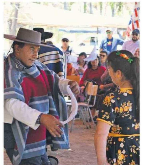
LA CEREMONIA CONTÓ CON LA PRESENTACIÓN DE PROYECCIÓN GUACOLDA.

XI VERSIÓN. En el Fundo San Ramón, sector de Los Loros, se llevó a cabo la XI versión de la tradicional Trilla a Yegua Suelta, organizada por el Club de Crianceros y Huasos del sector. La ceremonia contó con la destacada presentación de la agrupación folclórica Proyección Guacolda, que deleitó a los asistentes con sus danzas tradicionales. El evento no solo fue una celebración cultural, sino también una instancia de encuentro comunitario.