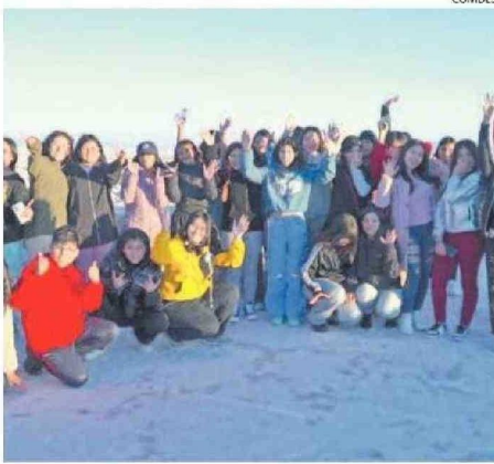
MÁS DE 90 ESTUDIANTES FUERON PARTE DE LA ACTIVIDAD.