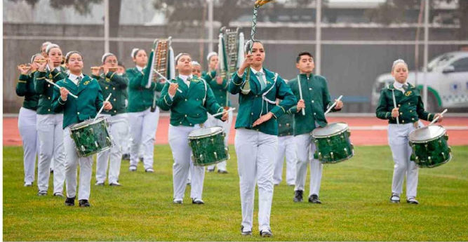
Impecables presentaciones de las bandas participantes.

Tiraje: 5.000 Lectoría: 15.000 Favorabilidad: No Definida