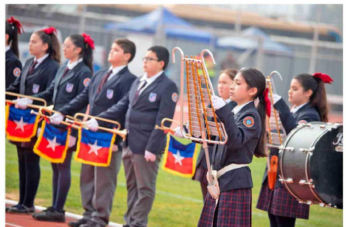
Fue una grata jornada de Concurso de Bandas Escolares de Guerra.