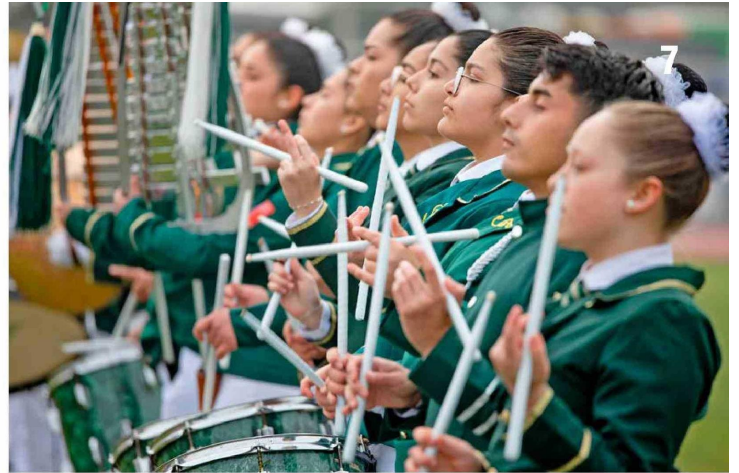
Todos los escolares demostraron su talento durante sus presentaciones.

perseverancia, entre otros que para nosotros como Carabineros y la comunidad son importantes", aseveró. En la oportunidad, agradeció la masiva participación de los colegios, y "el apoyo incondicional de los padres y apoderados para acompañarlos en este proceso".