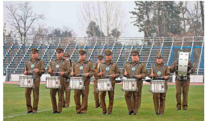
Fue una entretenida jornada en torno a los compases de las bandas de guerra.