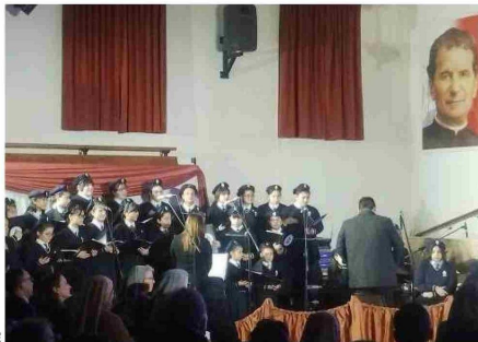
Las alumnas ofrecieron a los asistentes su destreza vocal en el canto.