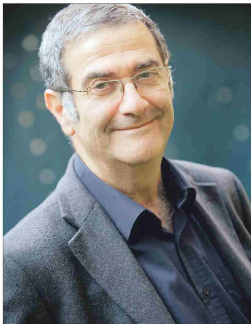
El francés Serge Haroche, premio Nobel de Física 2012 expondrá el miércoles 15 a las 15 horas.