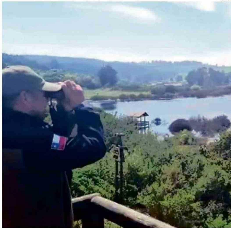
EL ESPEJO DE AGUA DEPENDE DE LAS LLUVIAS INVIERNALES.

La laguna cuenta con senderos adaptados para personas con movilidad reducida, de aproximadamente 500 metros de longitud. Además, existen dos