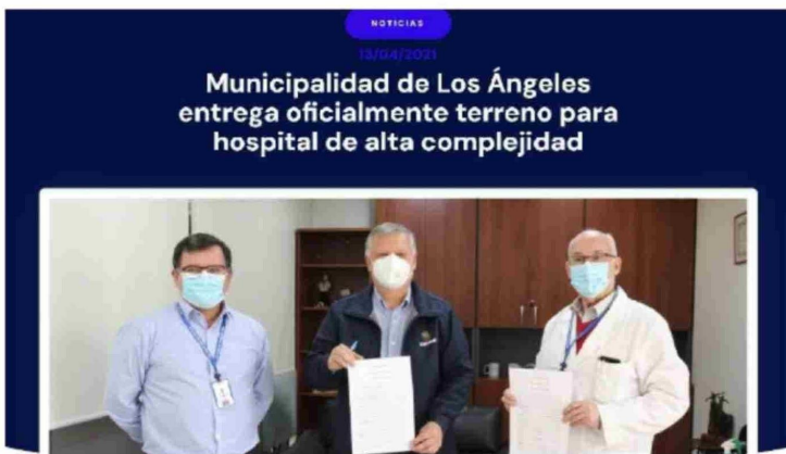
EN 2021, EN PLENA PANDEMIA, las autoridades de la época oficializaban el traspaso del terreno de los corralones al Servicio de Salud de Biobío para el nuevo hospital, iniciativa que fue descartada.

El administrador municipal reiteró que esta infraestructura es crucial para atender las crecientes necesidades de salud de Los Angeles y la provincia de Biobío. "Es un desafío comunal y provincial garantizar que contemos con este tipo de instalaciones para soportar las demandas de los vecinos", concluyó.