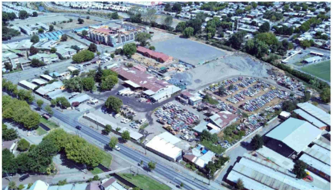
EL TERRENO DE LOS CORRALONES MUNICIPALES DE CALLE COLO COLO fue la primera opción evaluada para emplazar el nuevo hospital, pero fue descartado porque su espacio era insuficiente.

Ante el descarte predios municipales, surge la opción de la adquisición de una propiedad privada cercana a los 100 mil M 2 , que deberá pasar por todos los análisis técnicos necesarios para una megaobra que pretende albergar 28 especialidades y subespecialidades. ¿En qué está este proyecto? ¿Hay indicios de dónde se podría emplazar el nuevo centro asistencial de la capital provincial?