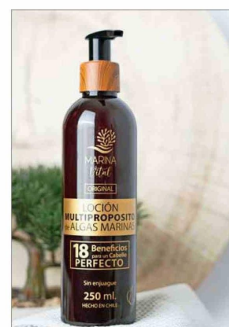
Loción multipropósito de algas marinas, el producto central de Marina Vital.