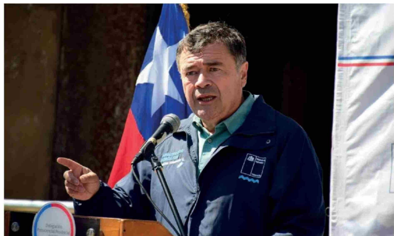
EL MINISTRO DE AGRICULTURA Esteban Valenzuela estuvo en Los Angeles donde se reunió con brigadistas forestales.

"Cuando enfrentamos fenómenos como el cambio climático y eventos naturales de fuerza incontrolable, no es posible que