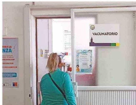
MANTENER CALENDARIO DE VACUNACIÓN PARA COVID ES CLAVE.

En tanto, desde la Seremi de Salud de la Región de