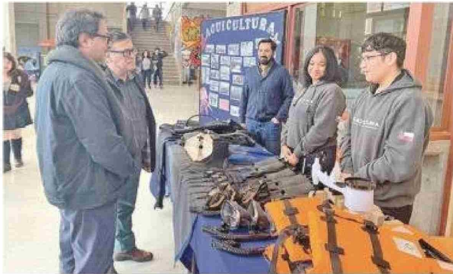
La especialidad de Acuicultura, que se imparte desde 2003, presentó una exposición sobre los implementos de buceo que utilizan en su formación.