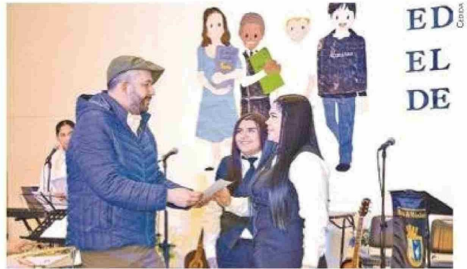
La empresa privada se hizo presente a través de Patagonia Blend, quienes certificaron a dos docentes y 4 estudiantes en curso de barista.