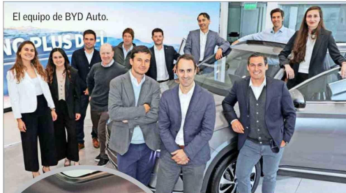
El equipo de BYD Auto.