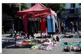
DERRUIDOS.— Sectores de la capital como Meiggs o la Vega Central se han deteriorado de la mano de la actividad informal.

Con distintos tipos de medidas, que van desde equipos de fiscalización hasta el aumento de permisos municipales, algunas autoridades han buscado enfrentar el fenómeno del comercio ambulante, que prolifera en barrios comerciales de las distintas ciudades.