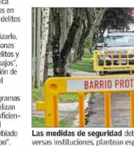
Las medidas de seguridad deben involucrar un esfuerzo mancomunado entre diversas instituciones, plantean especialistas.

Añade que "luego la estrategia debe considerar incentivos económicos para las familias y municipios para la reinserción escolar de jóvenes desahuciados, instalación de 'oficinas de oportunidades laborales' de cooperación público-privada para dar trabajos lícitos a jóvenes y adultos".