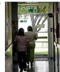
Actualmente, hay 2,5 millones de prestaciones atrasadas.

Otra propuesta, indica Sánchez, es "flexibilizar en forma inteligente la gestión médica para incentivar el trabajo fuera de horarios normales, sujeto a normas e incentivos claros y bien gestionados y supervisados para evitar el abuso", y "resignar más recursos a establecimientos que claramente los requieren, pero amarrados a cumplimiento de indicadores y metas, sancionando el incumplimiento".