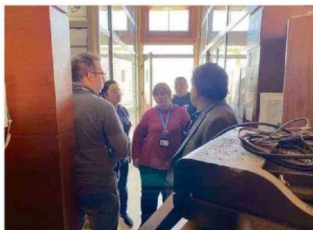
HASTA EL SAMU LLEGARON AUTORIDADES DE SALUD AYER.

pital Carlos van Buren de Valparaíso, señalaron en seis puntos: "No se registraron personas lesionadas por este lamentable hecho. Las razones no están determinadas y serán investiga-