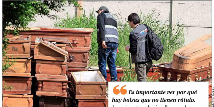
ATAÚDES. — Cajas mortuorias apiladas a metros de las bodegas y el crematorio hallaron también los fiscalizadores en su inspección.

El presidente de la Federación Nacional de Trabajadores de Ce-