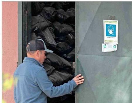
EN BOLSAS NEGRAS. — Las osamentas se encuentran acopiadas en dos bodegas del recinto.

Asimismo, el documento puntualiza que la bodega adyacente también es utilizada para guardar herramientas, palos, picotas, ras-