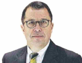
Por Sebastián Edwards